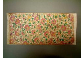
11番柄 花唐草(ピンク)