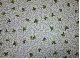
56・2番 唐草(グリーン)