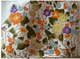
53・2番 盛り花(オレンジ)