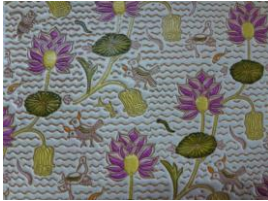
57番 HASU no HANA